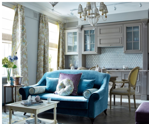
Проект №30. Студия Bernidesign, Нижний Новгород