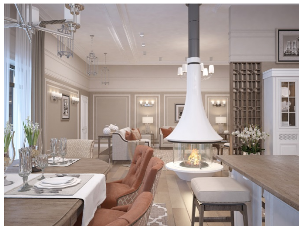
Проект №27. Студия «Архстройдекор», Нижний Новгород