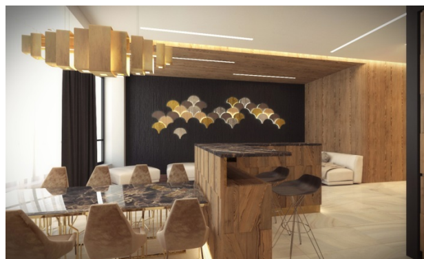
Проект №25. Студия REFORM, Нижний Новгород